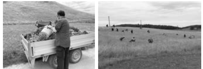
Fotos mit Eindrücken vom 1. Landschaftspflegetag in Sonnenbühl

b.rochner@kreis-reutlingen.de , Tel. 07121 480-3040